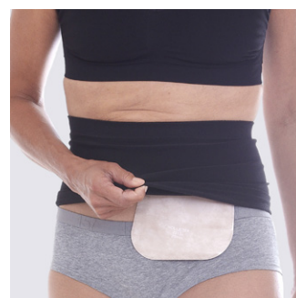
Passer behageligt både under og over undertøjet