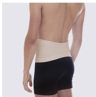
Smal form i ryggen