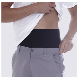
Diskret under tøjet