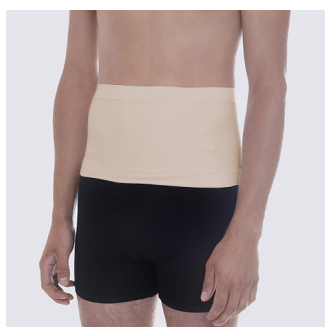
Skjuler stomi bandagen