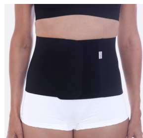
50222 - 20 cm, black