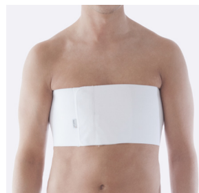
50221 - 16 cm, white