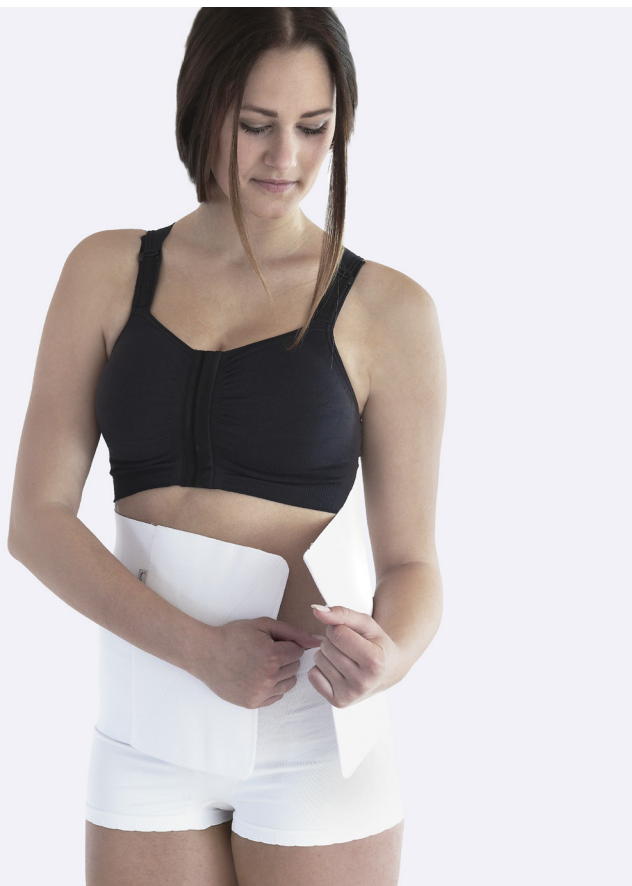
50203 - 32 cm, white