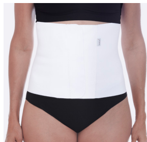
50202 - 25 cm, white