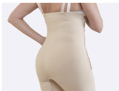
Strikket for at følge kroppens form.