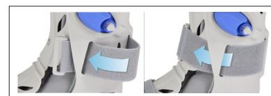
De cirkulære bånd kan trådes gennem yderdelen for at opnå maksimal komprimering.