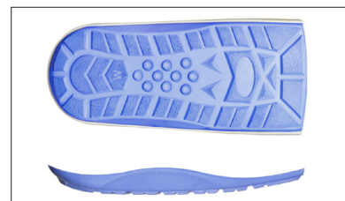
Lav rullesål til naturlig gangart.