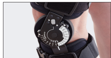
Forlængelse og bøjning kan justeres og låses fra 0° til 45° i intervaller på 10°/15°. Kontrolleret bevægelsesområde mellem 0° og 120° bestemmes let med en trykknop i intervaller på 10°/15°.