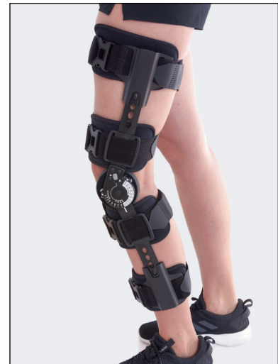
Med teleskopmekanismen kan ortosens længde justeres fra 50 cm til 63 cm.