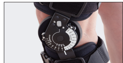
Forlængelse og bøjning kan justeres og låses fra 0° til 45° i intervaller på 10°/15°. Kontrolleret bevægelsesområde mellem 0° og 120° bestemmes let med en trykknop i intervaller på 10°/15°.