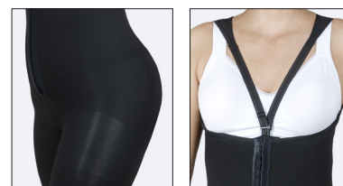
Skulderstropperne kan fastgøres foran eller i siderne.