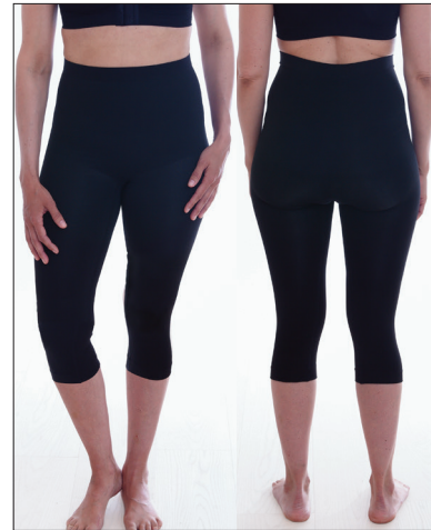
Silikone kant i taljen.