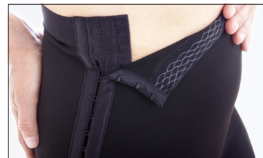
Hægte og krog lukning på begge sider samt silikone i linningen.