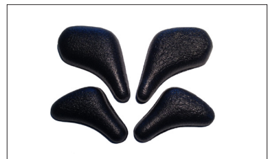
50257-00-50 Pads, Medium, 50257-00-60 Pads, Large