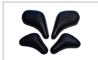
Art.no 50257-00-50 Medium, Art.no 50257-00-60 Large