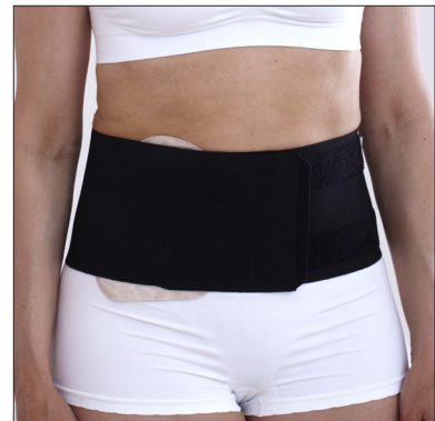
ViraRak 15 cm, 50230