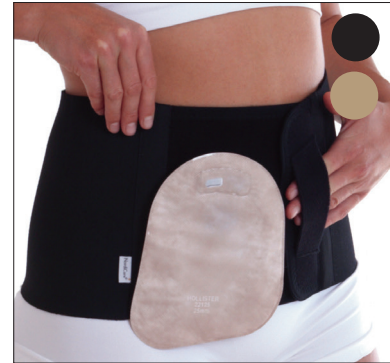
50212: 20 cm