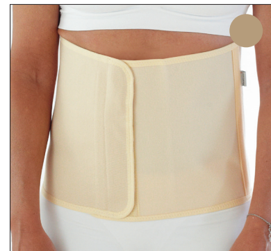
50210: 25 cm