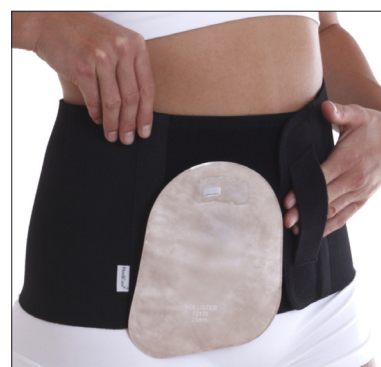
50212: 20 cm