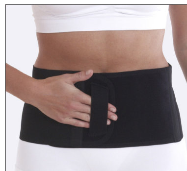
50211: 16 cm