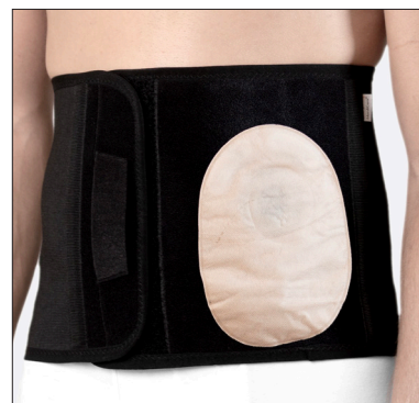
50210: 25 cm