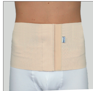
50204: 25 cm