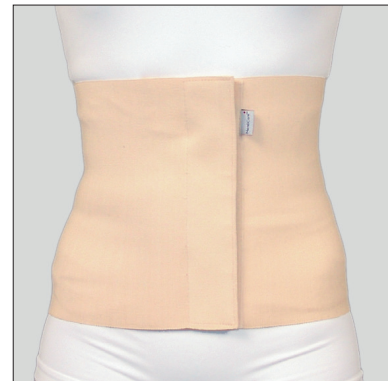
50205: 30 cm