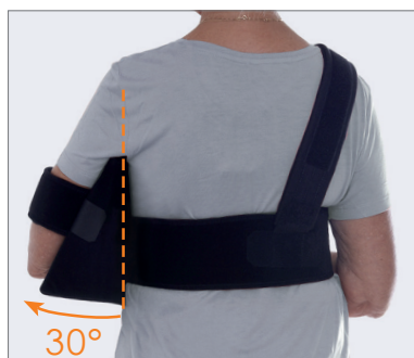
Abduktion 30 grader.