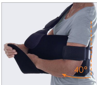
Elevation 40 grader.